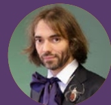
Cédric Villani (ENS 1992S)