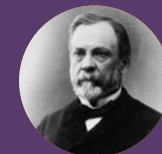
Louis Pasteur (ENS 1843S)

Pour continuer à développer notre École, ce lieu unique de formation de savants pour faire progresser la société et transmettre ses savoirs à tous.