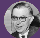
Jean-Paul Sartre (ENS 1924L)